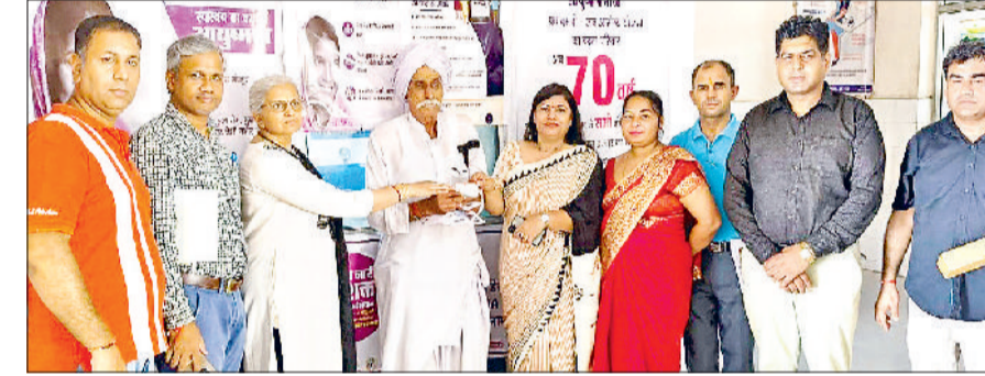
झज्जर। आभा आईडी वितरित करते हुए चिकित्सा अधिकारी।