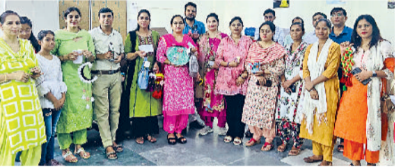
बहादुरगढ़। छारा कॉलेज में बनाई कलाकृतियां दिखाते स्टॉफ सदस्य।