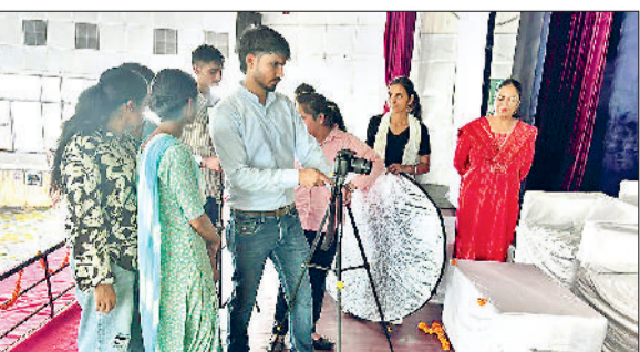
झज्जर। कैमरे की सेटिंग्स के बारे में जानकारी देते हुए विशेषज्ञ।