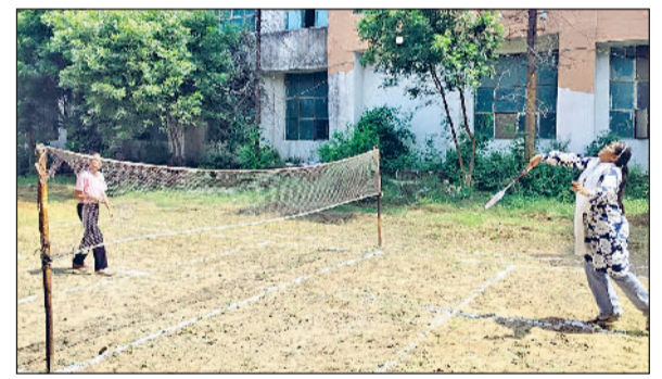
बहादुरगढ़। बैडमिंटन प्रतियोगिता में भाग लेती छात्राएं।