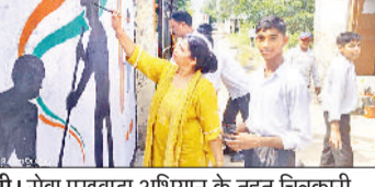
बेरी। सेवा पखवाड़ा अभियान के तहत चित्रकारी करते हुए अध्यापक और विद्यार्थी।