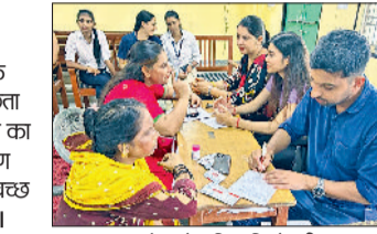
बहादुरगढ़। कैंप में प्रतिभागियों की जांच करतब स्वास्थ्यकर्मी।