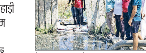
पैसे खत्म हो रहे हैं। सिर्फ मजदूर ही नहीं, कॉलोनी की कई छोटी दुकानें भी बंद हैं। जलभराव के बाद कई परिवार अपने घर छोड़कर रिश्तेदारों या सुरक्षित जगहों पर शरण लेने को मजबूर हो गए।

स्थानीय लोगों का कहना है कि प्रशासन की ओर से राहत कार्य धीमी गति से चल रहे हैं। पानी की निकासी न होने और रोजगार के साधन बंद होने के कारण लोगों के सामने दो वक्त की रोटी का संकट खड़ा हो गया है। यदि यह स्थिति जल्द नहीं सुधरी, तो छोटराम नगर के मजदूरों और छोटे व्यापारियों के लिए जीवन यापन करना और कठिन हो जाएगा।