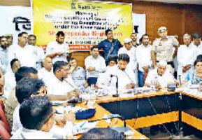
झज्जर। बैठक के दौरान दिशा निर्देश देते हुए सांसद दीपेंद्र सिंह हुड्डा।

झज्जर। शुक्रवार को जिला विकास समन्वय एवं निगरानी समिति दिशा की बैठक सांसद दीपेंद्र सिंह हुड्डा की अध्यक्षता में हुई। जिसमें सांसद ने बाढ़ग्रस्त क्षेत्रों में जलनिकासी की स्थिति, फसलों की विशेष गिरावरी, किसानों को मुआवजा वितरण, घर, दुकान, ट्यूबवेल, बोरवेल, पशुधन के नुकसान के सर्वे पर अधिकारियों से चर्चा करते हुए आवश्यक दिशा निर्देश दिए। उन्होंने कहा कि किसानों को फसल खराबे का कम से कम 70 हजार रुपए प्रति एकड़ मुआवजा दिया जाए। इसके अलावा घर, दुकान, ट्यूबवेल, बोरवेल आदि के नुकसान को भी सर्वे में शामिल